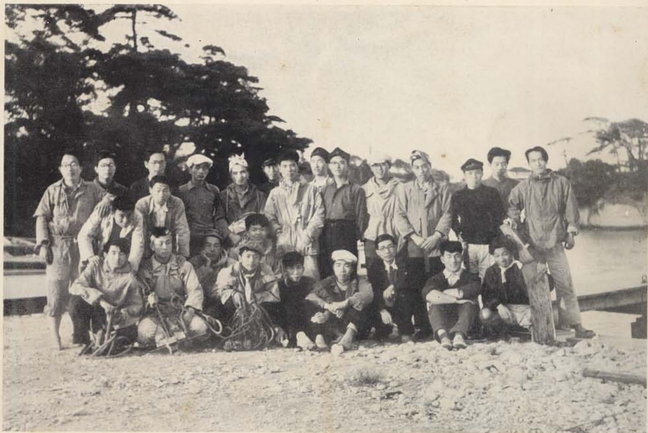
東北大学ヨット部現役陣並びに部長O.B