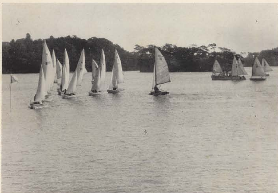
“オール・ジャパン” 雄島より経ヶ島方面を写す